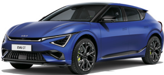
Yacht Blau Matt (DUM)