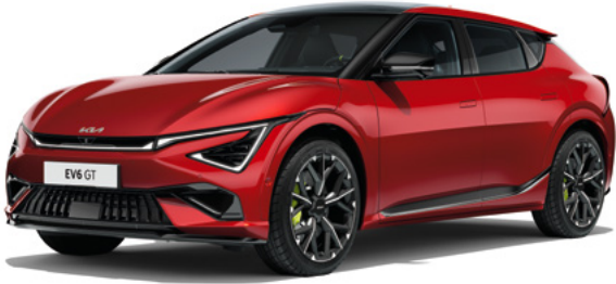
Runway Rot Metallic (CR5)

Der Kia EV6 GT ist so individuell wie du. Passe ihn deinem Stil an. Denn jedes Detail zählt.