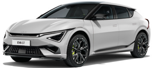
Wolfgrau Met. (C7S)