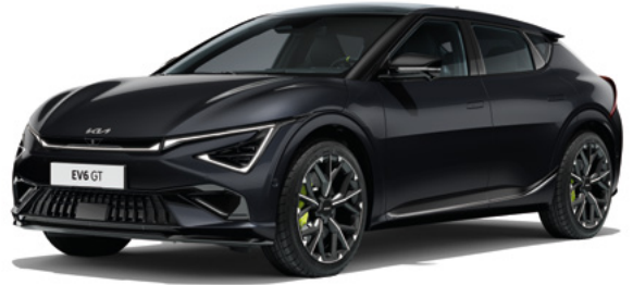
Auroraschwarz Met. (ABP)